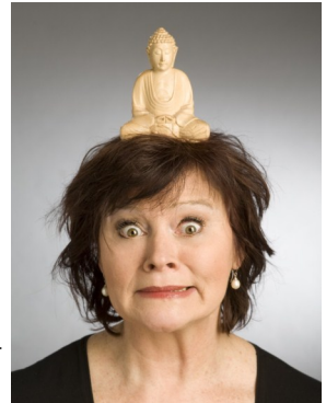
Kabarett—damit Ihnen ein Licht aufgeht!

Erleben Sie die alltäglichen Versuche, diese „ach so komplizierte Welt zu retten“, und noch „148 mails zu checken“, denn es passiert so viel!